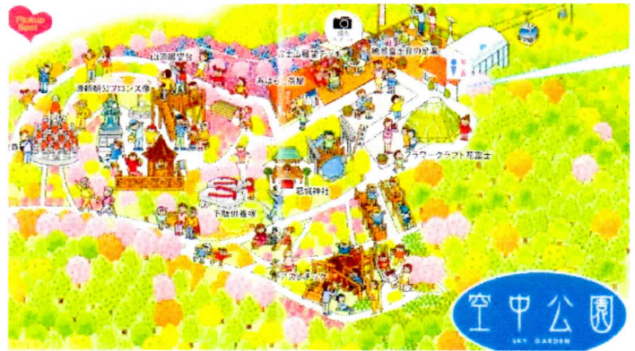
葛城山パノラマパーク空中公園が君を待っているぞ